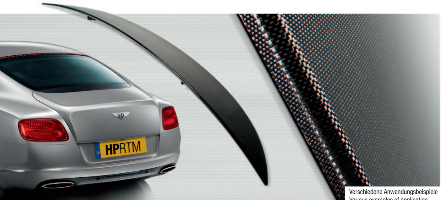
Verschiedene Anwendungsbeispiele Various examples of application

Because of the growing requirements regarding efficiency and environment the interest in lightweight construction solutions has constantly grown in recent years, especially in the automotive sector. The main focus is on extremely light high-performance components that until now have been realized using the resin injection process in closed moulds (Resin Transfer Moulding or RTM). Combining high-pressure technology and the classical RTM method, Hennecke's high-pressure RTM process breaks fresh ground in polyurethane processing technology and offers users a new engineering variant and an appropriate processing system.