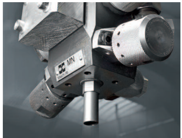
Exzellente Vermischungsqualität: MN-S Excellent mixing quality: MN-S