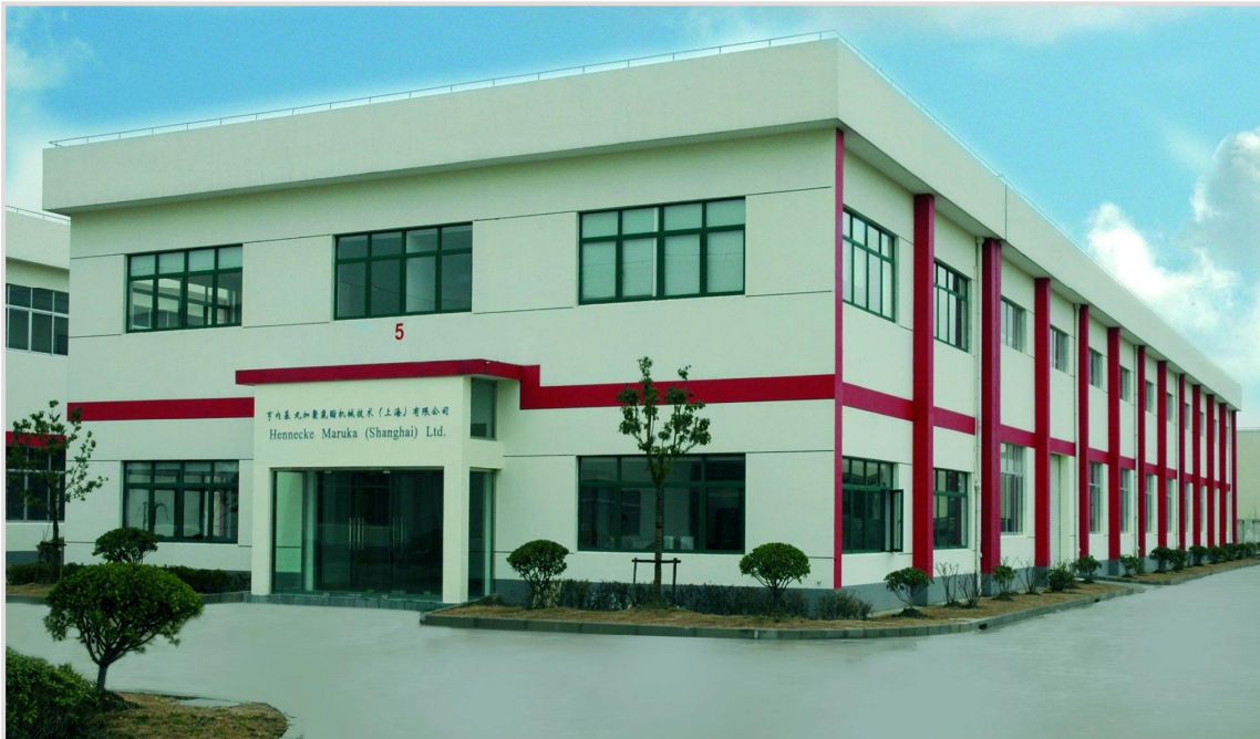
Das neue Werk Hennecke Maruka Shanghai