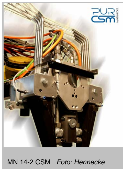
MN 14-2 CSM

Bestes Beispiel hierfür ist die Herstellung von großdimensionierten Composite-Bauteilen. Im Mittelpunkt steht dabei ein neuer Sprühmischkopf mit einer beachtlichen Gesamtaustragsleistung von mehr als 1000 g/s – ein Novum im Bereich der Sprühverarbeitung von Polyurethan. Dabei stellt der Neuzugang in der CSM-Mischkopf-Palette je nach