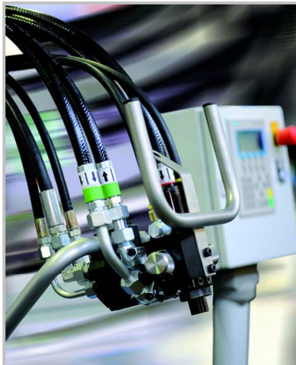
Luftgereinigter MXL Mischkopf

währte Dosiertechnik der Baureihen BaseLine und TopLine. Diese Kombination bietet Polyurethan-Verarbeitern eine präzise Komponentendosierung und ausgezeichnete Vermischungsqualität bei vielfältigen Anwendungen in den verschiedensten Bereichen. Die