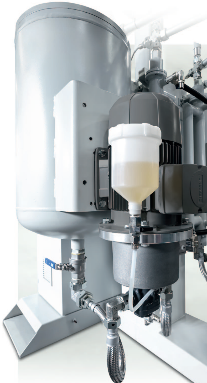
Precisione: pompe di dosaggio a frequenza controllata Precise: frequency-controlled metering pumps

The IMPACT machine's metering line includes precise and independently controlled gear type metering pumps driven by asynchronous motors. The double sealed pumps contain an integrated lubrication circuit. Frequency convertors ensure that each pump speed is precisely regulated. The speed can be set centrally via the operator panel and is linked to one of 19 available pouring programs as standard. The user can read the working pressure from the pressure gauge on the upstream side of each metering line. The maximum operating pressure of the pump is 20 bar. A pressure switch provides additional security to the user by turning off the metering pumps in the event of any excess pressure.