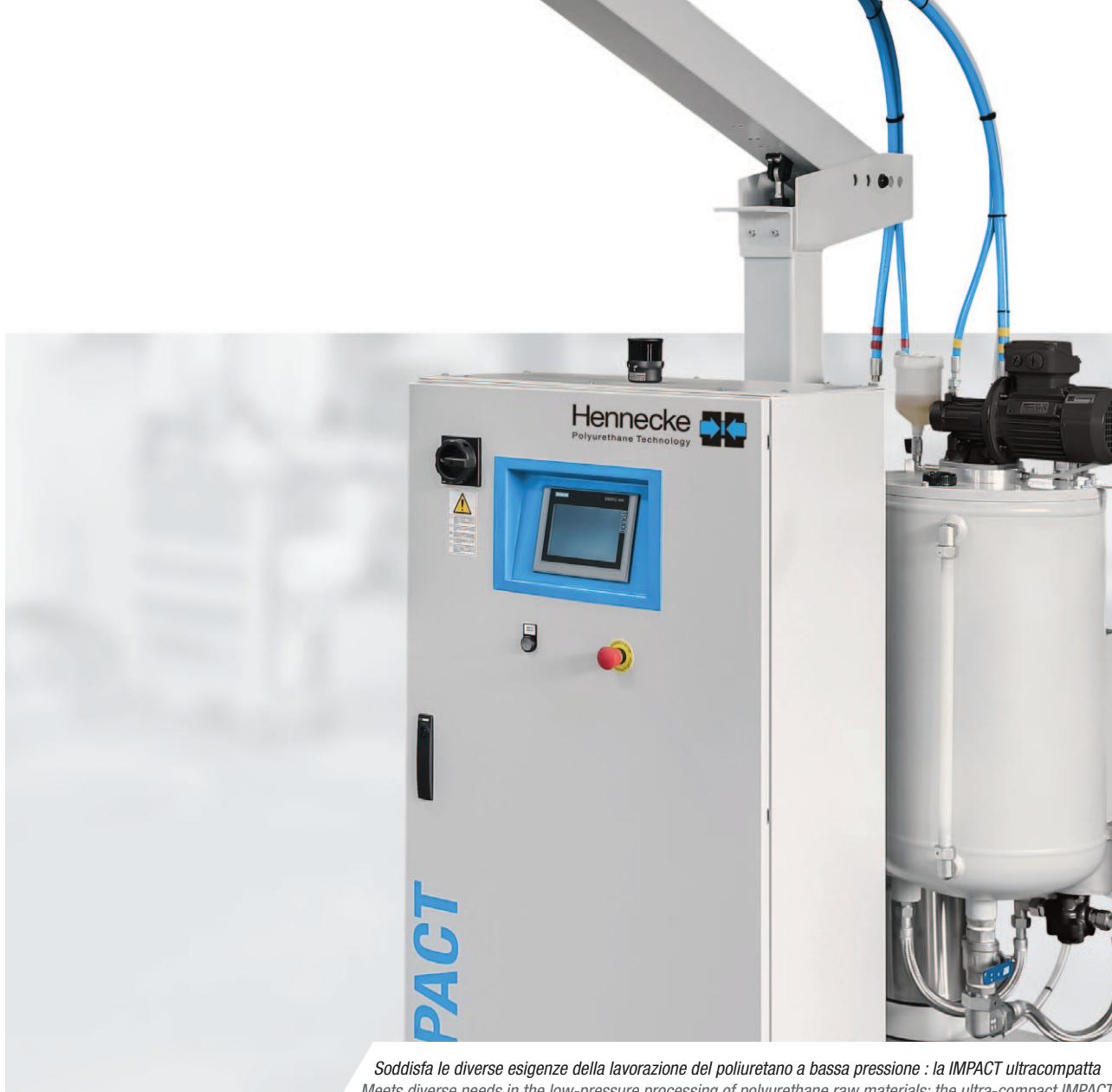
Soddisfa le diverse esigenze della lavorazione del poliuretano a bassa pressione : la IMPACT ultracompatta Meets diverse needs in the low-pressure processing of polyurethane raw materials: the ultra-compact IMPACT