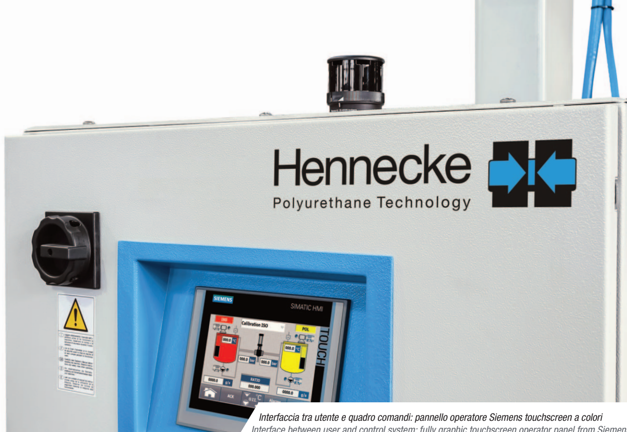
Interfaccia tra utente e quadro comandi: pannello operatore Siemens touchscreen a colori Interface between user and control system: fully graphic touchscreen operator panel from Siemens